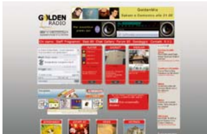
L'home page di Golden Radio ( www.goldenradio.it )

libero, per cercare la musica - ho comprato tanti di quei cd... -, realizzare la scaletta giornaliera con la regia automatica al computer, andare in diretta. Insomma, un sacco di impegni.