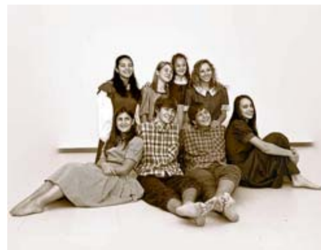
Gli interpreti degli otto ragazzi von Trapp

La trama. A Salisburgo, Maria, aspirante suora, non è tagliata per il convento. Sposerà invece l'affascinante barone von Trapp, padre vedovo di otto figli. Biglietti a 12 euro (8 i ridotti per Carta 60, iscritti Fita e bambini fino ai 12 anni). Intanto altre repliche in calendario: ad aprile, il 6 a Camisano, il 19 e il 20 a Isola; in giugno, il 7 e l'8 all'Astra di Vicenza.